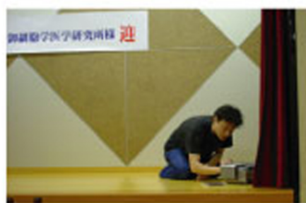
ざつようのはらせんせい。（涙）