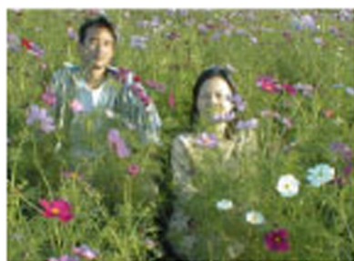
こらっ、ようじくん、それは すとーかーというのですよ！！