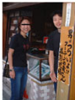
ゆきずりのひとと♡はらせんせい