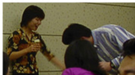
はよのまんねっ、けいいちくんっ！ ちえちゃん