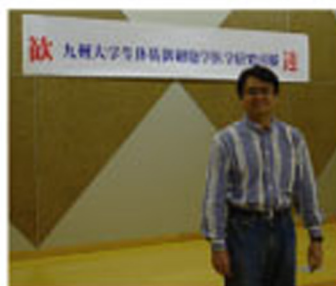
だいひょうしてけいいちくんのあいさつっ！ このあとのだいさんじはよそうでできなかったねっ。