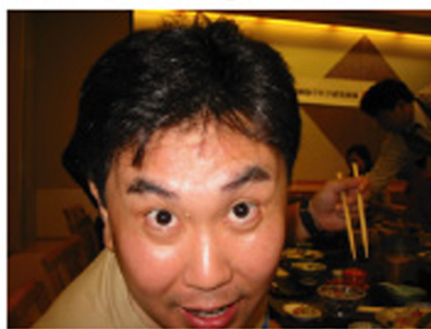
げんきいっぱいいただきまーす、しげつくくん。