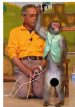
こわいおじさんと臭モン太