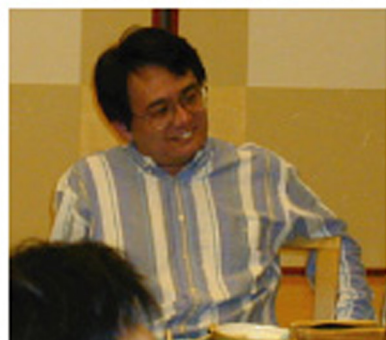
けいいちくんはもうおなかいっぱいかな？