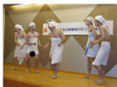
～パパッ、ママッ、ぼくいまいちばんかがやいてるよ～