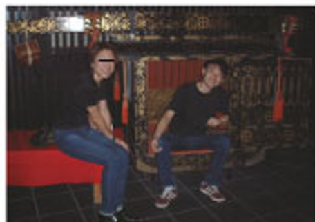
ぼくはよるのえんそくです。はらせんせい