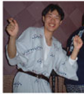
わからないけどうれちい。