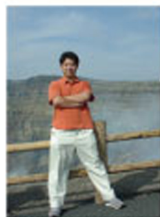
あそのふんえんなんて へっちゃらだい！