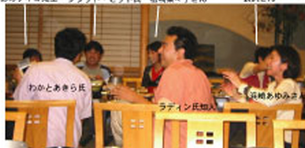
ごしょうたいしたちよめいじんのみなさんもおよろこび！