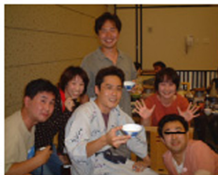
ごはんくださーい。みんなげんき