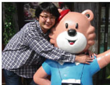
だいすきなおいぬさん？と♡ こーたけぼう